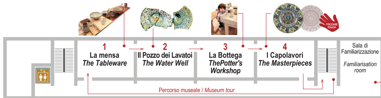
Primo piano - 1st Floor: Percorso crono tipologico dal 1200 al 1512 / Chrono-typological exhibition from 1200 to 1512