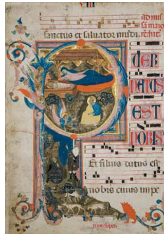
Jacopo del Casentino e Maestro delle Effigi domenicane antifonario, prima metà del secolo XIV Museo di Santa Verdiana