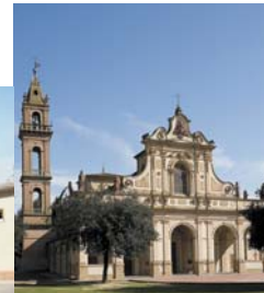
Santuario e Museo di Santa Verdiana