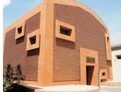
Be.Go. Museo Benozzo Gozzoli