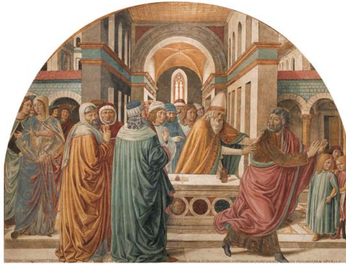
Benozzo Gozzoli Tabernacolo della Visitazione 1491, Museo Be.Go.

guarirli. Qui, le rassicuranti immagini di Maria, Gesù e dei Santi conservano ancora intatta la loro bellezza e la loro sacralità. Prima di terminare la visita, alcune postazioni multimediali invitano ad approfondire i dettagli degli affreschi o a scoprire di più sulla vita e le altre opere realizzate da Benozzo Gozzoli. Tutto il percorso è fruibile in italiano e inglese. Il Museo è completamente accessibile a disabilità fisiche e sensoriali, possiede un percorso di esplorazione tattile fruibile da chiunque in autonomia e supporti multimediali sottotitolati in italiano e inglese per le persone non udenti; è dotato di fasciatoio e di una piccola libreria per bambini e ragazzi. Organizza inoltre: - visite guidate in Italiano e Inglese - visite tattili per adulti e bambini - laboratori per famiglie - incontri e laboratori mensili per persone con Alzheimer e chi se ne prende cura - laboratori e visite guidate animate con gruppi scolastici di ogni ordine e grado.