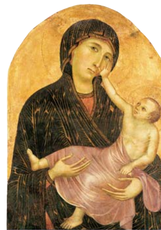
Cimabue e Giotto Madonna col Bambino ultimo decennio del XIII secolo Museo di Santa Verdiana